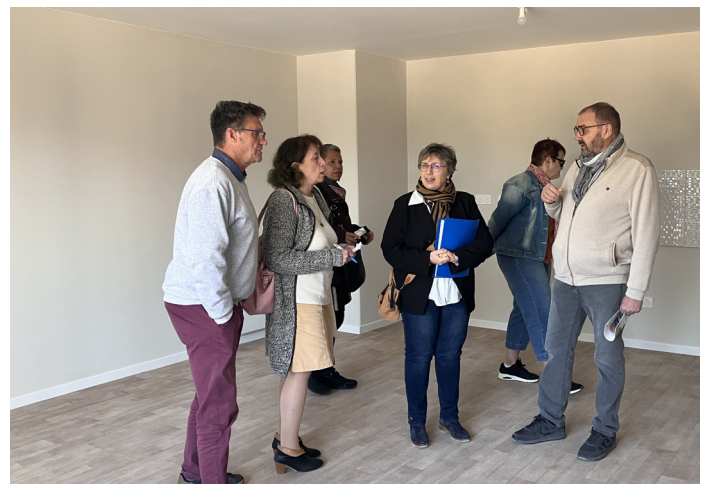
Visite Portes ouvertes le samedi 21 mars 2026

Samedi 21 mars 2026, ce sont plus de 500 visiteurs qui sont venus visiter l'un des 2 logements témoins de type 2 et 3. Ce nouveau bâtiment de 57 logements, situé rue de Laborde, à 200m de la gare SNCF et proche du centre-ville, sera livré par Nexity à Domany fin juin 2026. La qualité des logements et du bâtiment a été unanimement saluée par les visiteurs : beaux volumes, domotique, balcon pour chaque logement, prestations de très bonne facture,... Des logements dédiés aux jeunes de moins de 30 ans ainsi qu'aux séniors autonomes sont prévus dans cette résidence. L'entrée dans les appartements est prévue dès juillet 2026.