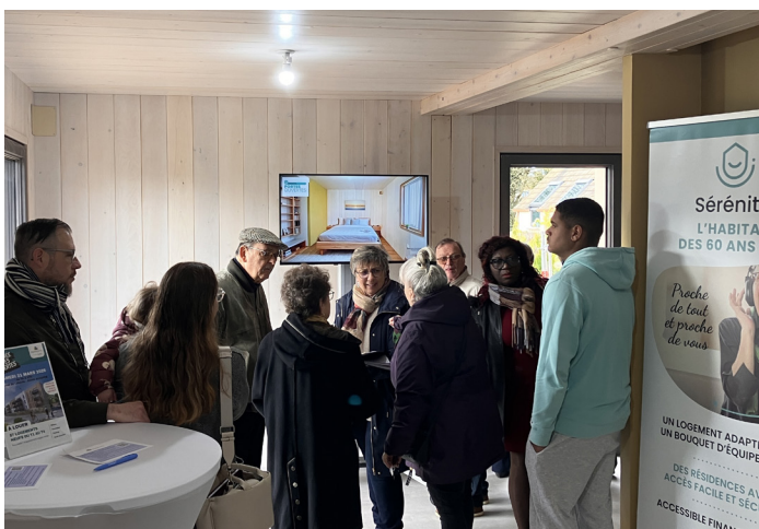
Visite Portes ouvertes le samedi 28 février 2026

Samedi 28 février 2026, près de 250 visiteurs se sont pressés pour venir visiter une maison témoin de type 2, sur ce programme innovant de 10 maisons individuelles (4 T2 et 6 T3) biosourcées et économes en énergie grâce à leur construction en système modulaire industrialisé en bois massif. L'opération, commercialisée sous notre marque Sérénitis et ciblant prioritairement les séniors, est également vertueuse dans la sobriété énergétique et la qualité des matériaux de manière à atteindre la performance RE2031. Les premiers habitants sont attendus dans les maisons en juin 2026.