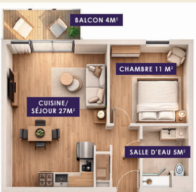
Exemple plan T2