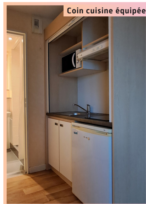
Coin cuisine équipée