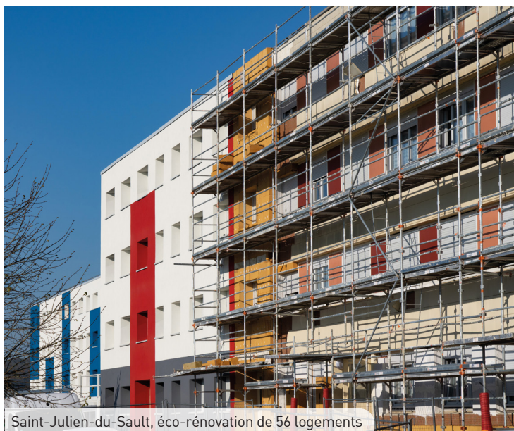
Saint-Julien-du-Sault, éco-rénovation de 56 logements

Chez Domanys, nous mettons l'accent sur la question énergétique, tout en tenant compte de vos moyens financiers.