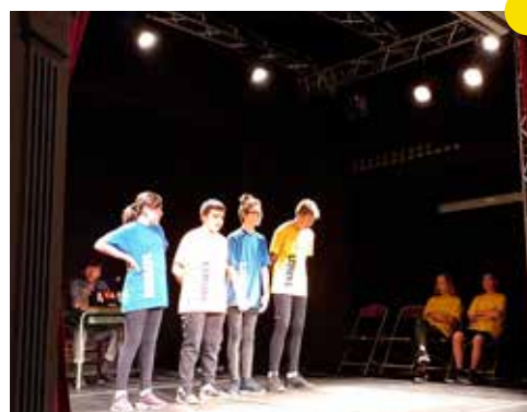
Représentation théâtrale des enfants des locataires Domanys, à Villeneuve-sur-Yonne

Au total, 62 actions subventionnées dans le cadre de l'appel à projets pour permettre de mener des actions qui font sens avec les valeurs de DOMANYS, apportent à nos habitants des services et améliorent le lien social et/ou la qualité de vie.