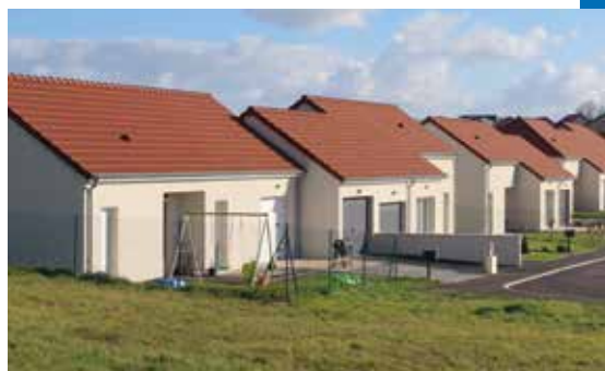
Saints-Geosmes (52) - Lotissement de pavillons HAMARIS